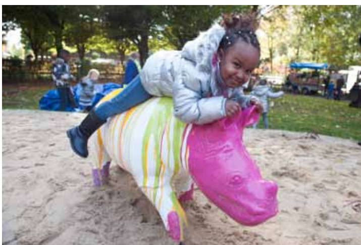
Afbeelding 5: neushoorns bij de Jantje Beton speelplek bij de kinderboerderij (Midden Brabantpark)

Een aandachtspunt is dat betrokkenheid niet automatisch leidt tot verantwoordelijkheid voor beheer. Jantje Beton is open en transparant geweest over het proces en heeft (samen met de gemeente) verantwoordelijkheden in kaart gebracht. Desondanks komen ervaringen in de praktijk niet altijd overeen met de verwachtingen van de partners.