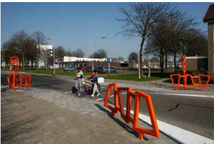
Afbeelding 1: Speciaal ontworpen Jantje Beton oversteekmarkeringen

Om het zelfstandig spelen zonder toezicht te bevorderen heeft Jantje Beton in de periode 1 januari 2010 tot en met 31 december 2013 samen met kinderen, ouders, buurtbewoners, gemeente en andere partners gewerkt aan het opzetten van een speelnetwerk in vier zogenaamde 'speelwijken'. Deze bevinden zich in Korte Akkeren in Gouda, Huizum in Leeuwarden, Stad binnen de Linie in Den Helder en Stokhasselt in Tilburg. Een speelnetwerk in een de wijk bestaat uit een aantal (formeel en informeel) speelplekken die worden verbonden door een 'speelroute'. Een speelroute is een zichtbare route met creatieve spelelementen en herkenbare oversteekmarkeringen. Daarnaast is een belangrijk kenmerk van speelnetwerk dat verschillende partners, zoals gemeenten, basisscholen, maatschappelijke organisaties, buurtbewoners en kinderen betrokken zijn bij de ontwikkeling ervan. Alle betrokken actoren hebben immers baat bij een goed speelklimaat in de wijk: het zorgt voor dynamiek en levendigheid, sociale controle en ontmoeting (meerjarenbeleidsplan 2010-2013).