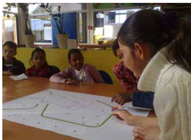
Afbeelding 6: kinderen denken mee over speelplekken in Stokhasselt