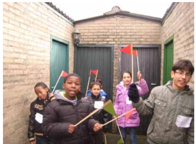
Afbeelding 2: kinderen wijzen leuke en stomme plekken aan in de wijk met rode en groene vlaggetjes