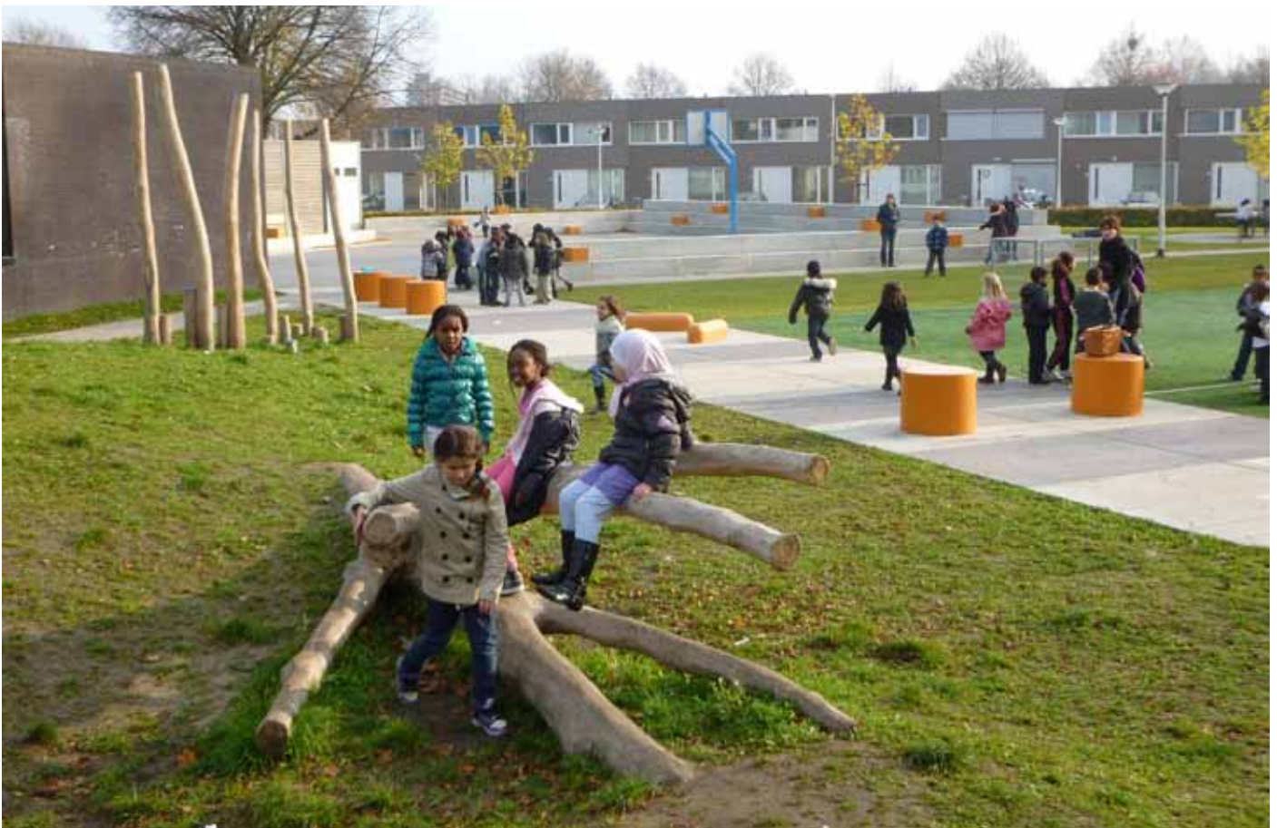
Afbeelding 4: Schoolplein de Lochtenbergh

Om vrij en aantrekkelijk buitenspelen te bevorderen heeft Jantje Beton tijdens het proces van co-productie niet alleen samengewerkt met kinderen, maar ook met bewoners en lokale organisaties in Stokhasselt. De wijk kenmerkt zich door bewoners met lage inkomens, die zelf over het algemeen weinig vertrouwen in instituties hebben. Dit wordt gecompenseerd door een sterk netwerk aan lokale organisaties rondom de Brede School met frequent onderling contact. Jantje Beton heeft de samenwerkingsverbanden op wijkniveau niet zelf tot stand gebracht, maar wel effectief met het bestaande netwerk samengewerkt en hen in korte tijd actief betrokken rondom het thema vrij buitenspelen. Ze heeft hierbij de waarde die zij hechten aan inspraak van betrokken kinderen, bewoners en ouders voor de leefbaarheid van de wijk duidelijk overgebracht.